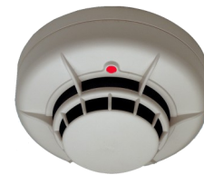
F-ECO1005T et F-ECO 1005

Le détecteur optique-thermique F-ECO1002 est un véritable détecteur combiné associant les 2 technologies.